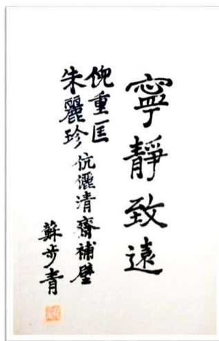
苏步青先生书赠倪重匡的条幅