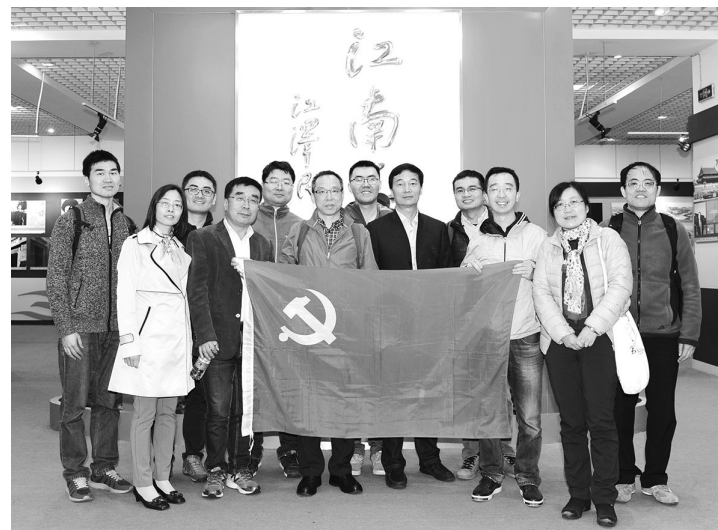
物化教工支部活动合影

教学方面,《物理化学》是国家级精品课程,教学团队是国家级教学团队,课程负责人和大部分团队成员是物化教工支部的党员。物化支部以物理化学精品课程为抓手,协助团队进行定期的教学研讨,年长的党员教师精心指导和帮助青年教师尽快参与到物理化学教学活动中。科研方面,物化教工支部的党员是化学系学术沙龙交流活动的骨干,为新进青年教师熟悉院系工作、开展自