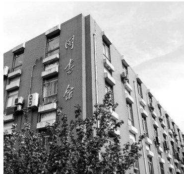
2001年 大修后的文科图书馆