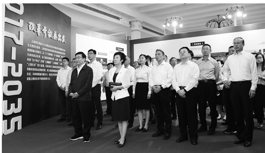
9月30日上午,学校新一届两委委员前往上海展览中心,集体参观“勇立潮头——上海市庆祝改革开放40周年”大型主题展览。

“一切伟大成就都是接续奋斗的结果,一切伟大事业都需要在既往开来中推进……奏响改革