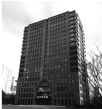
2017年 复旦大学康泉图书馆