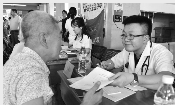
为贫困地区群众义诊