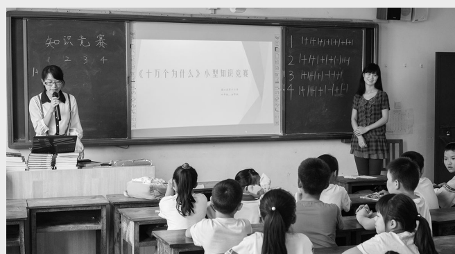
研究生在云南德宏州小学的阅读课上主持知识竞赛