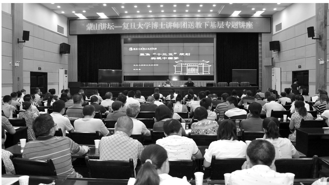
社会实践是研究生教育的重要组成部分，对提高研究生的综合素质、培养复合型人才具有积极作用。图为我校博士生讲师团在基层的讲座。

为了充分发挥研究生科研学术能力，党委研究生工作部尤为支持将第一课堂和第二课堂有效衔接的实践项目申报，鼓励研究生申报与自身专业高度契合的实践项目和挂职岗位，提倡不同专业背景的研究生跨学科组队申报实践项目。这一做法不仅使研究生在社会实践中运用和检验理论知识，而且不断深化其对理论知识的认识。其中，2016 年医科专业研究生积极响应学校实践育人