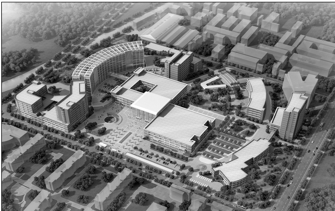
■ 国家儿童医学中心(上海)建设将助推附属儿科医院再攀新高。(图为该院“十三五”期间总体布局效果)

国家儿童医学中心(上海)将承担全国或区域性疑难危重疾病诊治,带动全国或区域内医疗服务能力的提升;协助制定我国儿童重大疑难疾病的诊疗指南和行业规范;组织开展儿科专业住院医师规范化培训和专科医师培训,培养临床技术骨干和学科带头人;建立儿童重大疾病监测系统,确定儿童健康问题研究的学科发展方向,从国家层面组织国际顶尖水平的临床医疗与科学研究合作,推动研究成果向临床应用转化,从而引领我国儿童卫生事业的全面发展。