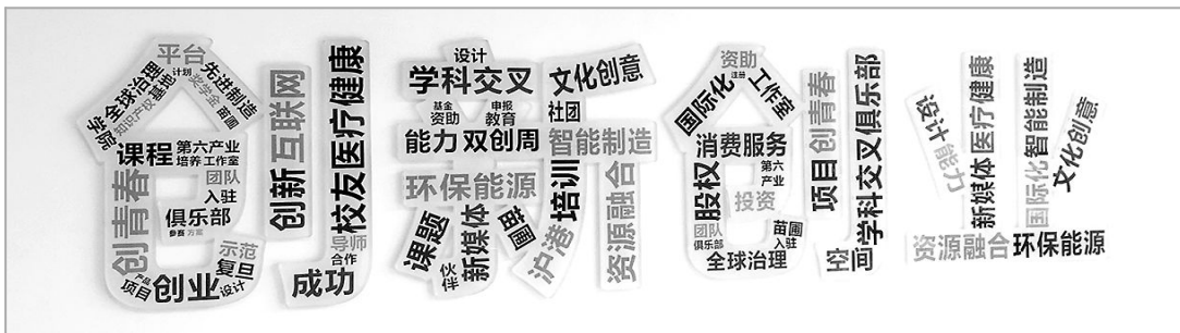
图为位于四号楼创新创业学院墙贴。

复旦大学在全国高校第一批设立大学生科创项目,成立本科生院以通识教育理念贯穿整个培养过程,成立青年创新中心、大学生创业园等等,这些重要的改革举措均走在全国前列。党的十八大以来,学校以提升创新能力、提高人才培养质量为核心,以创新驱动发展战略、服务经济社会为导向,全面整合校内外优势资源,把创新创业教育融入人才培养全过程。2016年,复旦大学荣获“全国首批创新创业典型经验高校”称号;近日,复旦大学又入选“全国首批深化创新创业教育改革示范高校”(全国共99所,上海3所)。