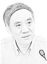
全国人大常委会 委员、财政经济 委员会副主任委 员、民建中央副 主席辜胜阻:

“实现供给侧结构性改革,需要系统性的制度创新。这个创新主要两方面,一个是基本制度层面,一个是宏观调控层面。基本制度层面,实际上要通过深化改革,解决国家、市场、企业的定位。要让市场在资源配置当中切实发挥决定性作用;要让政府在宏观调控以及长远的社会发展和市场失灵的领域,确实起到主导作用。宏观调控层面,最现实的一个挑战就是如何穿越中等收入陷阱。中国推动供给侧结构性改革,推动民主法制的建设,有能力穿越这个陷阱。”