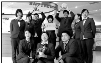
华山医院便民服务中心