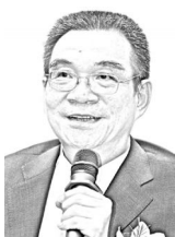
北京大学新结构 经济学研究中心 主任、北京大学国家 发展研究院名 誉院长林毅夫:

10月16日,众多知名经济学家、学者与来自国家智库、研究机构、金融机构的业界精英云集“复旦首席经济学家论坛”,聚焦“十字路口的中国经济——机遇与挑战”,为中国经济金融发展提供智力支持。本届论坛由复旦大学经济学院、复旦大学经济学院全球校友会主办。首席经济学家论坛旨在打造一流的经济学家生态圈和产学研一体的论坛,通过每年的论坛活动,组建全球经济、金融、跨学术界的各领域专家团队,立足全球,根植中国,着眼于国计民生,关注经济金融领域的问题,寻求不同的解决方案。论坛以促进中国经济在新常态下的国家宏观调控、产业升级、经济运行、金融安全等领域的研究为宗旨,致力成为提升国家竞争力的学术平台。论坛以履行公共服务使命为己任,将讨论和研究的成果,与社会各界分享,力求引导中国及世界经济的良性发展。论坛也承载着服务于国家最高决策的建议角色,通过一系列的学术公关课题,实现经济学家的社会责任。