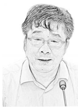
中国人民大学校 长刘伟:

“去年中国经济增长速度为1990年以来最低,有内部的体制机制、增长模式、结构的问题,但其他金砖国家与亚洲的一些高收入经济体下滑更大,说明主要是共同外部性原因。中国的经济增长确实要更多依靠内需。适度扩大总需求跟结构性改革并不矛盾,两者相辅相成。保持适度的投资增长,能够创造就业,增加家庭收入,消费就会保持比较正常的增长。实现经济6.5%以上的增长,只要政策到位,是完全有可能的。”