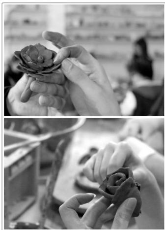
复旦陶艺协会日常活动

在下午开展的工作坊中,8位来自各学校的老师或同学分别从不同维度总结自身经验,发表独