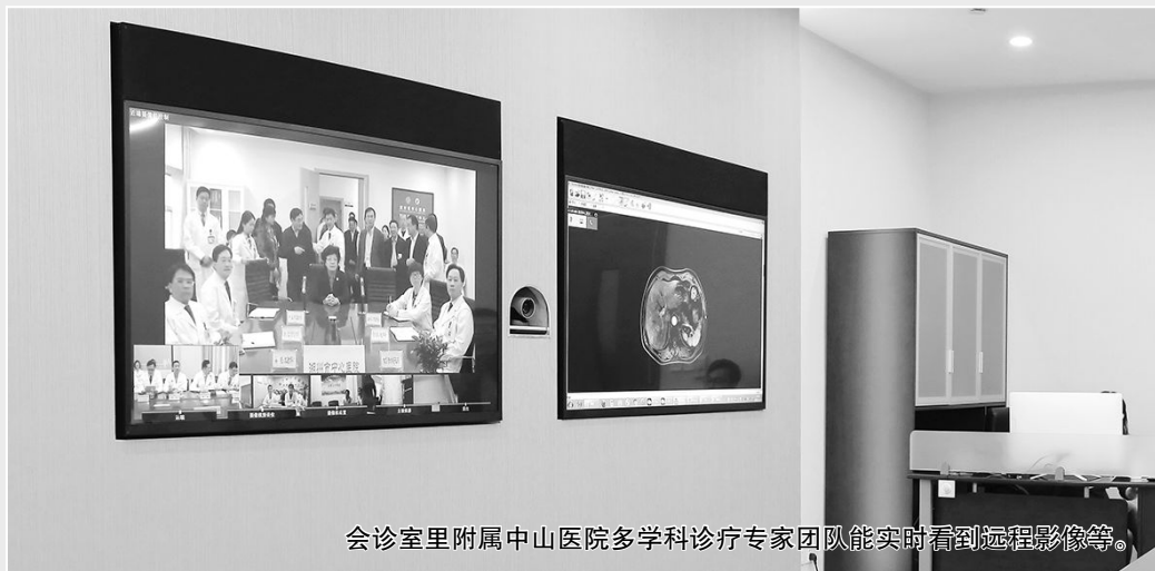
会诊室里附属中山医院多学科诊疗专家团队能实时看到远程影像等。

11 月 16 日,吴阶平医学基金会—复旦大学附属中山医院区域医疗协作体远程会诊服务中心迎来了该中心启动以来的首个会诊病例。会诊期间,正率队视察浙江省远程医疗开展情况的国家卫生计生委主任李斌来到浙江省湖州市中心医院新落成的吴阶平医学基金会—复旦大学附属中山医院区域医疗协作体远程会诊室现场观摩。