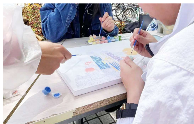
腾飞书院4月1日举办“我眼中的校园生活”活动,同学们用画笔勾勒出校园生活的点点滴滴。