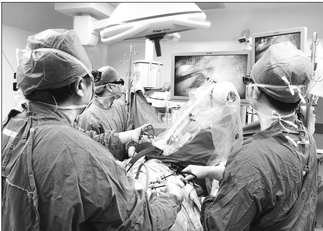
■ 附属中山医院结直肠癌中心团队在实施机器人微创手术。

围手术期方案相比,患者术后营养状况更好,应激程度更轻,外周血单核细胞HLA-DR的表达水平下降幅度小,胃肠道功能恢复加快,术后平均住院天数由7天缩短至5天,住院费用均分下降15.6%,术后并发症发生率减少12.8%。