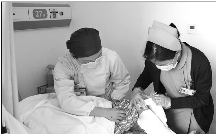
■ 在病区为患者重度腐臭伤口进行清创和换药。

校医管处同时鼓励各医院开展院级层面“我身边的医德医风”主题征文活动，并将其作为医院落实我校医德医风和行风建设主题教育活动的具体举措之一。 文 / 何珂