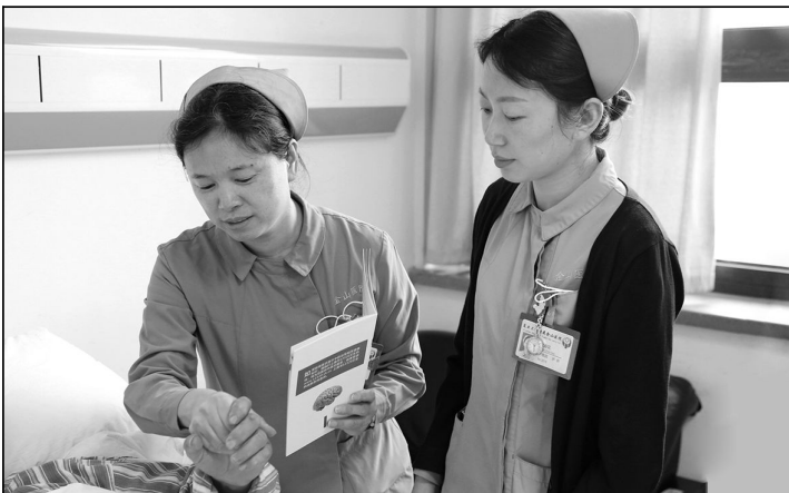
■ 开展住院患者健康知识宣教并带教年轻护士。