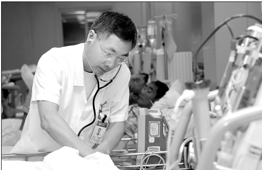
■ 丁小强教授:附属中山医院肾内科主任,上海市肾病与透析研究所所长。

丁小强教授及其团队围绕急性肾损伤这一临床危重症的早期诊断、有效预防和血液净化治疗策略等开展了系统深入的研究,并取得一系列创新性成果,有效提高了急性肾损伤诊治水平,在一系列重大医疗抢救和保健任务中发挥重要作用。同时优化了血液净化治疗策略,为以往无法耐受血液净化治疗的重症患者创造了治疗机会,需要肾脏替代治疗的危重急性肾损伤的死亡率从47.1%下降至25.0%,救治成功率达到国际一流水平。分别受国家卫计委和上海市卫计委委托,制订“急性肾损伤临床路径”和“连续性肾脏替代治疗技术管理规范”等指南规范。丁小强教授及其团队连续6次主办急性肾损伤和血液透析国际学术会议,成为急性肾损伤领域国际三大学术交流平台之一,有力提升了我国在急性肾损伤领域的国际地位。本期“杏林大讲堂”由丁小强教授为读者们介绍急性肾损伤的相关知识。