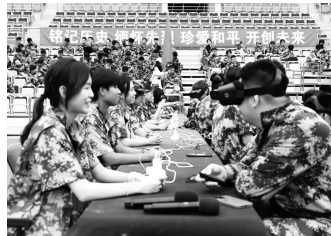
在一次次“飞行”尝试中翱翔天空