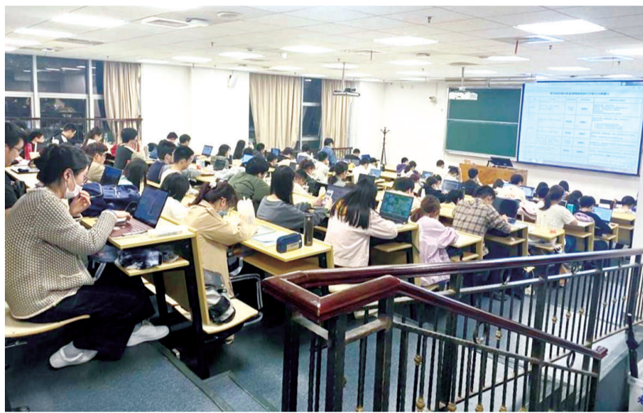
课前十五分钟,已经满满当当的教室

通过党史授课,传达理性看待和敬畏历史的思想,让学习者真正立足于马克思主义立场观点方法,去思考和理解理论观点背后的科学逻辑和深刻意义——这是《中国共产党历史》这门课程的应有之义。