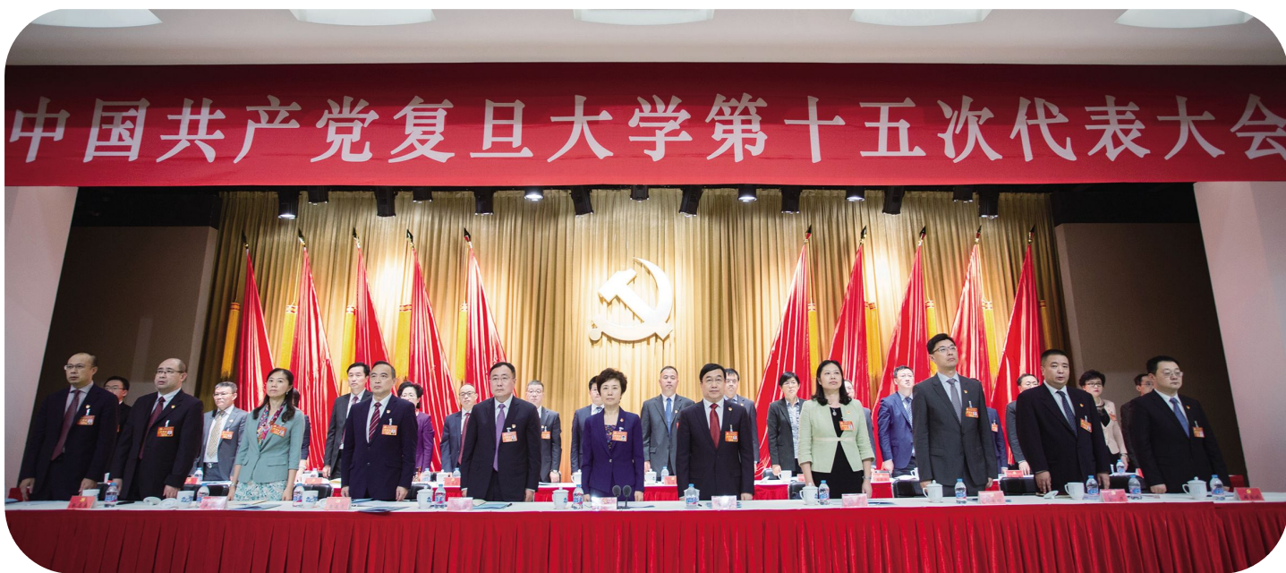
中国共产党复旦大学第十五次代表大会胜利闭幕