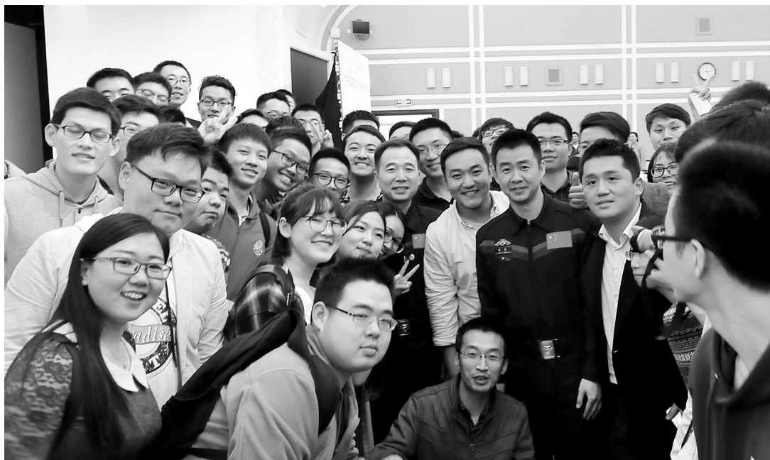
报告会结束后,景海鹏、陈冬与复旦学子合影。

神舟五号,大家没有看到我的身影和名字;神舟六号,大家看到了我的名字,但是没有看到我的身影;神舟七号终于看到了我的身影。