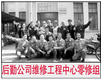
后勤公司维修工程中心零修组

研究院是学术生产的窗口，已经成为了学校服务国家和地方发展的窗口，联系政府、企业、高校、媒体的纽带。研究院是学术和咨政研究国际化的窗口，通过多年的建设，研究院已经成为国内高校智库国际化的引领者之一。研究院是新型人才培养的窗口，已经探索出“智库育人”的有效渠道。