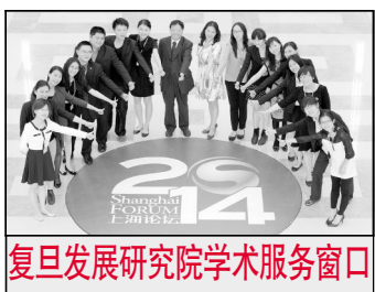
复旦发展研究院学术服务窗口

发展研究院秉承“建设高端智库，服务国家发展”使命，作为学校人文社会科学大平台，自2011年恢复运营以来，孵化及服务了9个研究机构、5个国际论坛及3个海外中心。研究院以咨政育人根本目标，以“学术生产”、“国际化”和“学术服务”为主要路径，学术为本、服务为本，打造复旦特色的智库窗口。