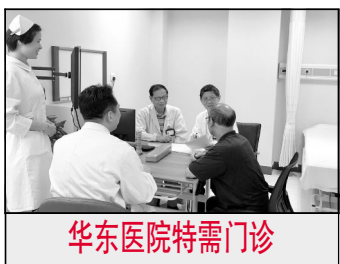
华东医院特需门诊

续三年接单量达8千多张，全年无投诉，任务单用户评价满意率近100%。班组个人和集体先后获得了“复旦后勤服务明星”“上海高校绿叶奖”“上海高校后勤2014年文明窗口”“2015年全国高校校园物业特色单位（校园设备维护）”等荣誉和称号。服务口号是“您的满意就是我们的服务目标”。