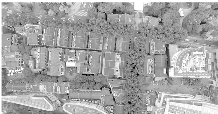
▲中国共产党“一大”会址航拍图

历时 5 个月，我校航空航天协会的学生们组装无人机，航拍了 7 处党的足迹，追溯城市光荣记忆，为党的 95 周岁生日献上一份来自青年学子的特殊礼物。