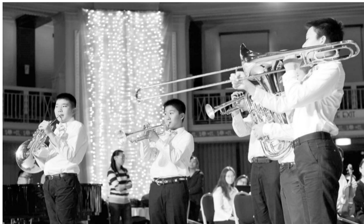
自闭症患儿们正在演出铜管五重奏。

“沙龙”也会组织孩子们去做一些为社会献爱心的公益活动,比如地铁志愿者。家长一开始很排斥,他们不愿意承认自己的孩子有自闭症。但看到孩子肯和别人说话了,可以在家做一些