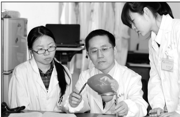
■ 对学生们进行临床专业知识的带教和指导。