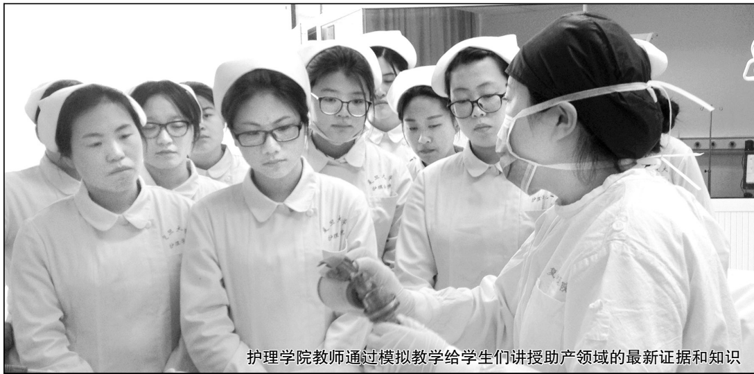
护理学院教师通过模拟教学给学生们讲授助产领域的最新证据和知识

循证护理是将科研结论与临床经验以及病人愿望相结合,获取证据作为临床护理决策依据的方法。譬如,长久以来术前 8 至 12 小时禁食禁饮一直是围手术术前准备的重要内容,但过长时间的禁食禁水会导致患者出现脱水、低血糖等不适,不利于患者术后的早期康复。禁食禁水的时长是否有理论依据?禁食禁水的时间是否可以缩短?随着护理学科的发展,临床护理人员开始重新思考传统护理技术与护理方法的