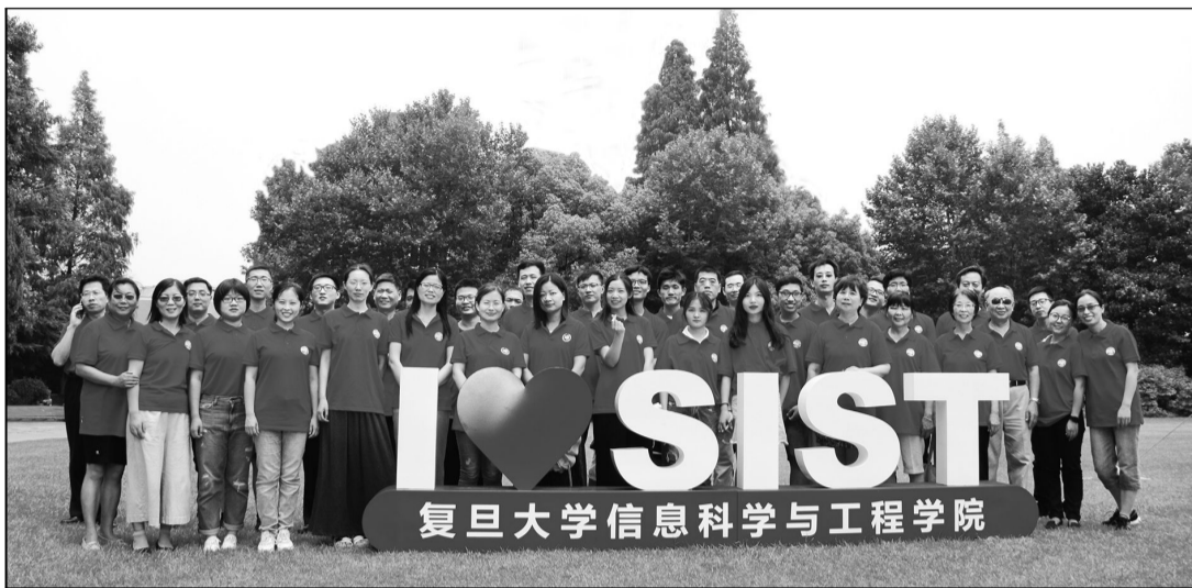
■ 信息科学与工程学院党委组织党员开展“七一”主题党日活动。

党的十九大报告指出,要进一步加强应用基础研究,拓展实施国家重大科技项目,突出关键共性技术、前沿引领技术、现代工程技术、颠覆性技术创新。校党委书记焦扬所作的复旦大学第十五次党代会报告强调,要以“双一流”学科建设为动力,优化布局、凝练方向、提升能级,推动优势学科率先登顶、主干学科加速攀升、新兴学科跨越发展、交叉学科融合创新。