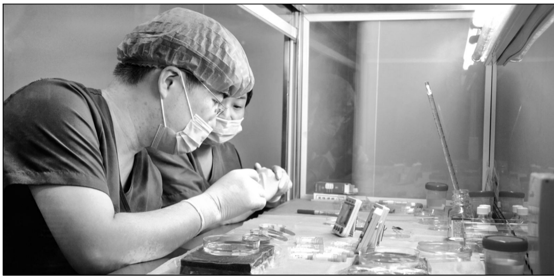
■ 图为附属妇产科医院工作人员对卵巢组织进行相应处理。

“女性生育力保存技术包括胚胎冷冻、卵子冷冻和卵巢组织冷冻等。其中,卵巢组织冷冻移植技术在近年来受到了越来越多的重视,冷冻复苏移植后的卵巢组织不仅可以保留卵巢的内分泌功能,还有可能实现生育功能,不论对于年轻妇科肿瘤患者的保育治疗,还是对于其它有可能影响生育能力的妇科或非妇科领域的特殊疾病患者的治疗,以及针对一些可能影响生育能力的特殊状况的处理,都有着十分重要的临床价值。”徐从剑介绍说。冻存卵巢组织移植技术在欧洲已经开展了十余年,目前全世界已经有160余例经冻存卵巢组织移植后出生的健康孩子。然而,国内在这一领域的发展尚处于起步阶段。复旦大学附属妇产科医院未雨绸缪,把目光聚焦全生命周期的起始点,从源头助力未来,从临床需求到付诸科研再到反哺临