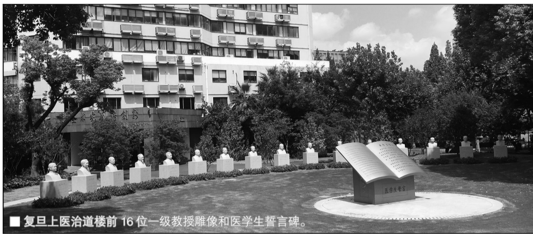
■ 复旦上医治道楼前16位一级教授雕像和医学生誓言碑。

《新英格兰杂志》收录全球顶尖医学成果。近两年，复旦上医成为该刊“常客”：2018年1月，