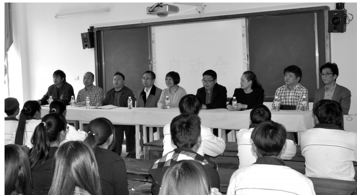
今年3月,后勤公司领导在永平职高宣讲。

“如果她们毕业之后想要留在且苑工作,我们已经为她们联系上海开放大学免试入学,并通