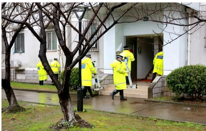
▲ 邯郸校区演练场景