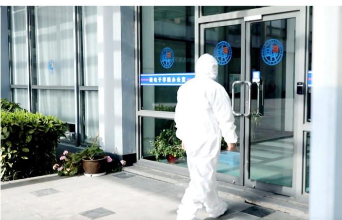
▲ 张江校区演练场景

本报讯 3月24日，我校分别召开校园准封闭管理期间院系党委书记座谈会、机关部处长专题座谈会。学校疫情防控工作领导小组组长、校党委书记焦扬主持会议并讲话。