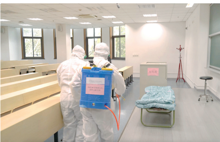
▲ 江湾校区演练场景