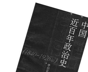
《中国近百年政治史》 作者:李剑农 出版:复旦大学出版社

该书介绍了西方法理学理论的发展历史和各大流派,流派之间互有联系,往往新流派是在批判和继承旧流派的基础上形成的。