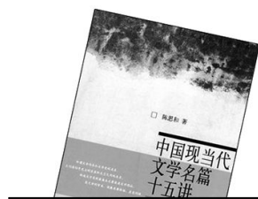
《中国现当代文学名篇十五讲》 作者:陈思和 出版:北京大学出版社

该书带读者进入了十二部现当代文学名著:《狂人日记》、《知堂文集》、《电》、《边城》、《雷雨》、《十四行集》、《生死场》、《骆驼祥子》、《子夜》、《倾城之恋》、《长恨歌》、《坚硬如水》,提供更多言说的可能性。作者不仅带读者领略了美不胜收的文学之旅,而且教给了领略文学风景的隐秘钥匙。