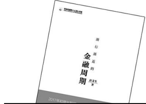
《渐行渐近的金融周期》 作者:彭文生 出版:中信出版社

该书由作者的成名作《最近三十年中国政治史》及补写的篇章合刊于 1942 年。这是一部编著最早、在海外影响很大、在取材与叙事方面颇具特色的中国近代政治史著作,依次介绍了鸦片战争、维新运动的初步、维新运动的反动、革命与立宪的对抗运动、中国国民党改组与北洋军阀的末路等内容。