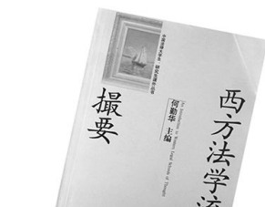
《西方法学流派撮要》 作者:何建华 出版:中国政法大学出版社

该书带读者进入了十二部现当代文学名著:《狂人日记》、《知堂文集》、《电》、《边城》、《雷雨》、《十四行集》、《生死场》、《骆驼祥子》、《子夜》、《倾城之恋》、《长恨歌》、《坚硬如水》,提供更多言说的可能性。作者不仅带读者领略了美不胜收的文学之旅,而且教给了领略文学风景的隐秘钥匙。